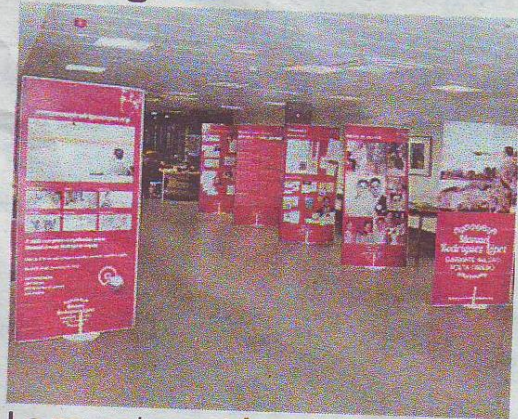
La muestra está en la Nodal.